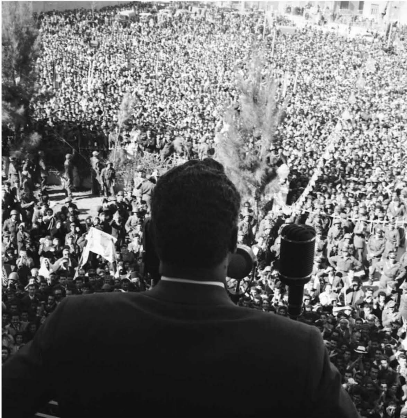
عبد الناصر يعلن الدستور المؤقت للجمهورية العربية المتحدة ١٩٥٨/٣/٥